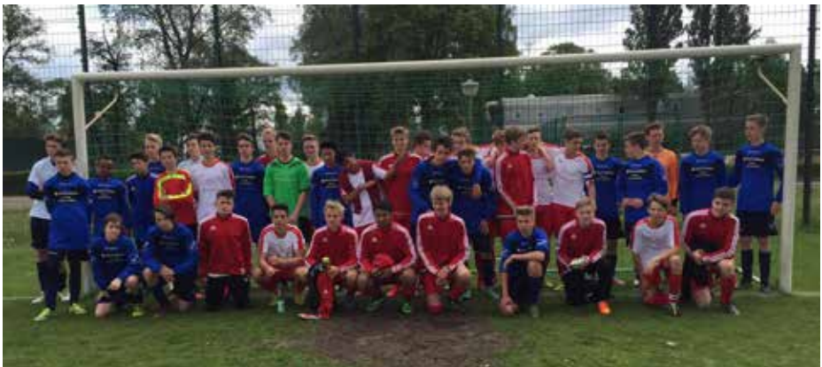
TuS B-Jugend nach dem Freundschaftsspiel in Berlin