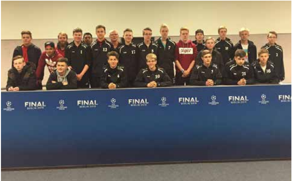
TuS B-Jugend bei der Pressekonferenz nach dem Spiel im Olympiastadion

bis ins Allerheiligste des Stadions. Die Jungs waren begeistert! Um zwei ging es dann auf den Heimweg. Alles in allem war es ein super tolles Wochenende! In der Hoffnung, den Endspurt um die Meisterschaft gut anzugehen und den Teamgeist nochmals zu beschwören. Mit den Worten der Jungs: „.....Berlin hat uns verändert“